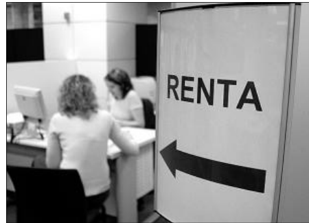
Sólo el 10% de las pymes afrontan sin temor el cierre contable.

A este respecto, Velasco indica que "un asesoramiento fiscal correcto es aquel que, además de realizar una correcta aplicación y planificación de la fiscalidad de la empresa, le permite optimizar sus recursos y lograr el máximo beneficio y le asesora sobre los