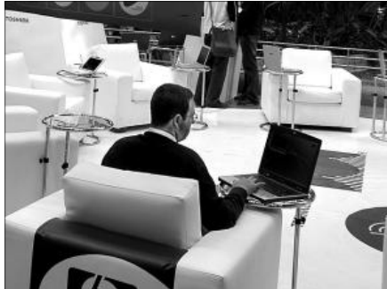
Telefónica y Wolters Kluwer creadores del nuevo servicio en la Red.